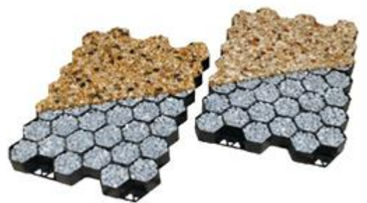
外寸：35.5cm × 26.0cm