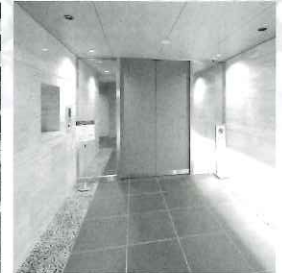
マンションのエントランス