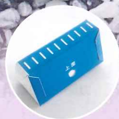
組立式ハンマーヘッド ノズル付き